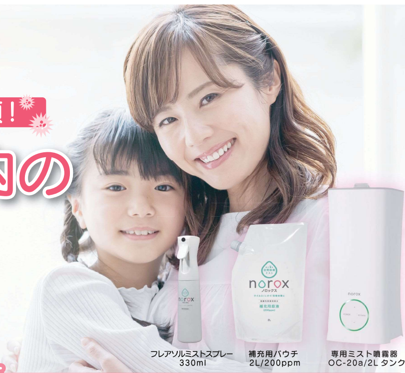
フレアソルミストスプレー 330ml